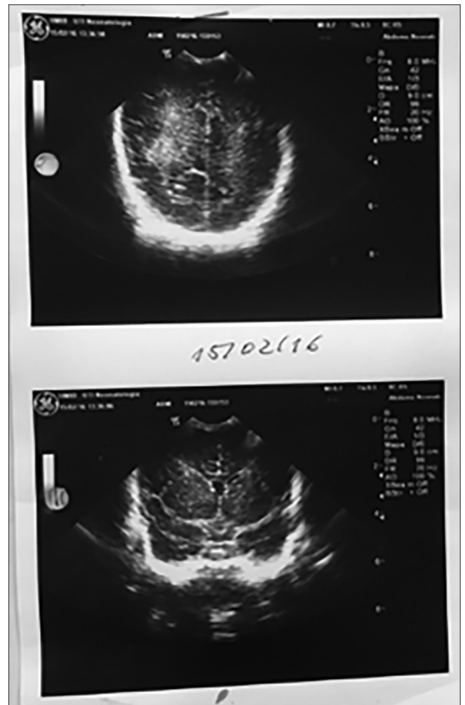
Figura 1. Ultrasonido transfontanelar mostrando hiperecogenicidad periventricular hacia la izquierda.

Durante la internación fueron solicitadas dos ultrasonografías transfontanelares, siendo que en la primera que fue realizada en el octavo día de vida postnatal se evidenció la hiperecogenicidad periventricular hacia la izquierda (Figura 1) y la segunda, la que fue realizada en el 17º día de vida postnatal, mostró una hiperecogenicidad periventricular bilateral y colpocefalia hacia la izquierda. Posteriormente, en el 43º día de vida (o en la 6ª semana post-concepcional), fue realizada una tomografía computadorizada de cráneo cuyo resultado fue la presencia de asimetría de las astas occipitales, siendo mayor hacia la izquierda y sin otras alteraciones anatómicas (Figura 2). El examen de resonancia magnética de cráneo, el que podría demostrar mejor las alteraciones anatómicas existentes u otras malformaciones concomitantes,