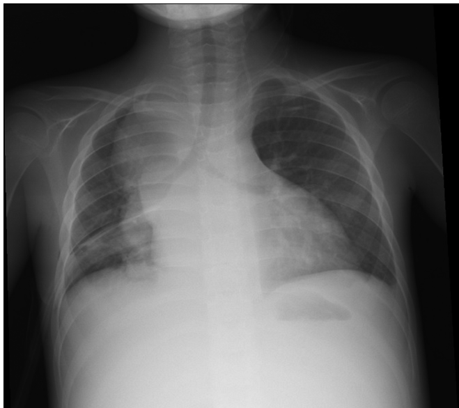
Figura 2. Raio-x de tórax evidenciando massa mediastinal.